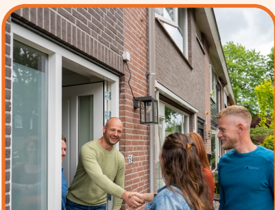
Landelijke open dagen