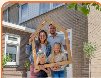
2.250 duurzame huizen